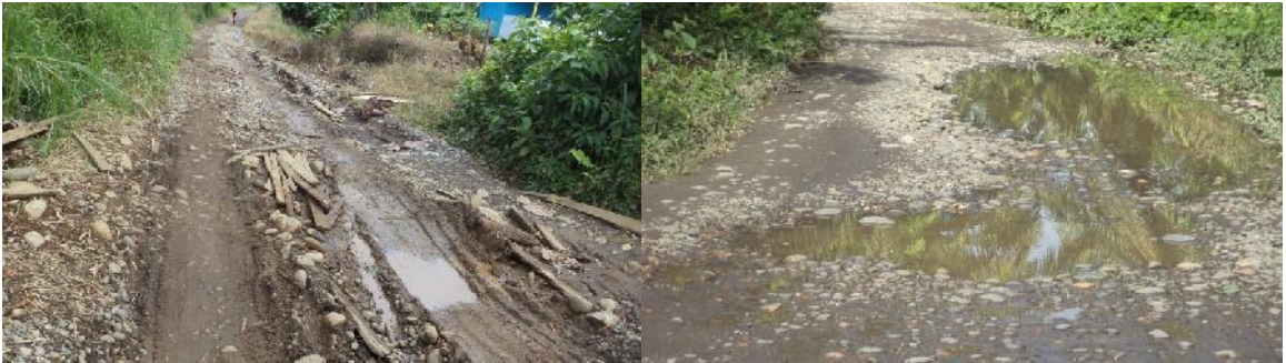
Mal estado de las vías.